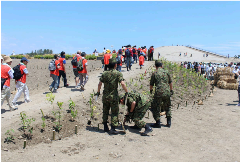
図 4 「緑の万里の長城」プロジェクトにおける植樹活動

海岸防災としての実際の有効性は別として、「緑の万里の長城」プロジェクトは、従来の海岸防災の考え方を大きく転換する可能性を秘めている。第一に、これまで海岸防災は主として行政や専門家の領域と考えられてきたが、このプロジェクトでは社会のあらゆる立場の人々が主体的に関わる取り組みとなっている。その意味で、このプロジェクトは、防災事業であると同時に社会的な取り組みでもあり、東北地方のみならず日本各地の人々が、将来世代の安全に貢献し、生態環境の改善に寄与するとともに、震災の記憶を継承する機会となっている。第二に、これまで海岸防災施設は、人と海とを隔てる「境界」として捉えられることが少なくなかったが、このプロジェクトでは、むしろ人々を海へと再び結び付ける媒介となっている。「千年希望の丘」でのフィールドワークにおいて、Boret は、多くの人々が丘の頂上へ続く階段を楽しげに登り、安心感を抱きながら海岸や海を眺めている様子を観察した。このように、「緑の万里の長城」は、生態学的な持続可能性と社会的なつながりの双方を実現する新しい海岸防災のあり方を示している。