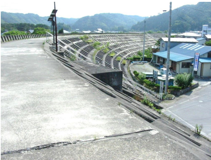
図 1 2011 年東日本大震災以前の岩手県宮古市田老地区の防潮堤

Dewit [7] はこの状況について、「日本は、ダム、道路、河川改修、海岸整備、トンネル、橋梁建設に対して比類ない執着を示し、その過程で膨大なコンクリートと鉄鋼によって自然環境を改変してきた」と批判的に論じている。東日本大震災後に進められた防潮堤の再建事業も、防災という目的だけでなく、こうした戦後日本の公共投資政策と地方経済を支えてきた歴史的な文脈の延長線上に位置付けることができる。