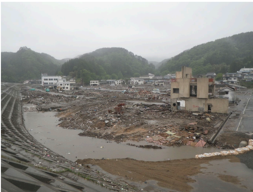
図 2 2011 年東日本大震災後の田老防潮堤

震災後、東北地方の海岸防御政策をめぐって活発な議論が交わされた。例えば、田老防潮堤の X 字型構造は津波エネルギーを中央部へ集中させた可能性が指摘されている。また、一部地域では防潮堤同士の連続性が十分でなかったことや、河川沿いの軟弱地盤によって堤体の損傷が拡大したことなども報告されている [3]。震災からわずか 2 日後には、『ニューヨーク・タイムズ』紙が、防潮堤の限界について以前から専門家の間で警鐘が鳴らされていたと報じた [11]。さらに Aldrich と Sawada [12] は、統計分析に基づき、防潮堤の存在そのものは死亡率の低下に有意な効果を示さなかった一方で、地域社会の結束（ソーシャル・キャピタル）は避難行動に大きな影響を与えたと指摘している。生存者の多くは、近隣住民や友人から避難を促されたり、自宅まで迎えに来てもらったりしたことによって避難を決断していたのである。