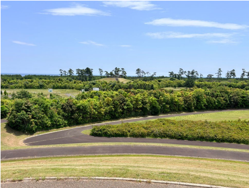
図5 完成した「緑の万里の長城」プロジェクト（岩沼市「千年希望の丘」）。2011年の東日本大震災から15年後の2026年6月19日に撮影。植樹された広葉樹林は大きく成長し、避難丘全体を覆う成熟した森林となっている。本写真は、防災、環境再生、震災の記憶の継承を統合したプロジェクトが完成段階に至った姿を示している。